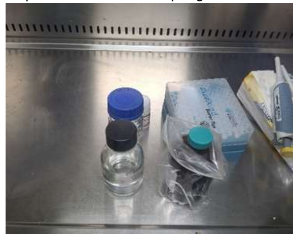
Gambar 1. Persiapan reagen ekstraksi DNA metode Guanidium isothiocyanate

menit, setelah 10 menit tambahkan larutan etanol sebanyak 400 ul absolut, homogenkan dengan vortex selama 2 menit, setelah itu ditambahkan 200 ul larutan cloroform lalu di centrifuge dengan kecepatan 12.000 rpm selama 1 menit, setelah di centrifuge di dalam tabung terbentuk 3 lapisan, lapisan atas berwarna bening yang tengah berwarna putih dan yang bawah berwarna pink atau merah, setelah itu ambil bagian atas dan tengah dari sampel yang sudah di centrifuge, kemudian ditambahkan etanol 70% sebanyak 200 ul lalu di centrifuge dengan kecepatan 12.000 rpm selama 1 menit, setelah dicentrifuge terbentuk endapan dan supernatannya di buang, lalu tahap pencucian ditambahkan 2 ul larutan etanol 70% kemudian dicentrifuge dengan kecepatan 12.000 rpm selama 3 menit, setelah 3 menit buang supernatan lalu ditambahkan RNA Free water dan DNA sampel hasil ekstraksi siap digunakan.