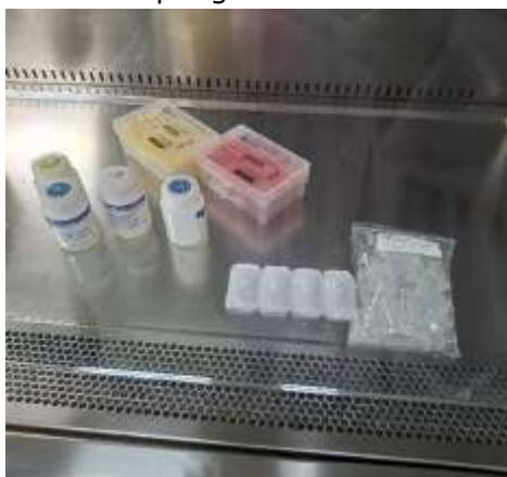
Gambar 2. Persiapan reagen ekstraksi DNA metode Filtrasi tube

cairan ditube bagian bawahnya dibuang, setelah itu ditambahkan larutan wash buffer sebanyak 500 \mu l di column tube, kemudian dicentrifuge dengan kecepatan 12.000 rpm selama 1 menit, setelah itu cairan dibagian tube bawahnya dibuang, kemudian cairan di atasnya di larutkan sebanyak 2 kali, setelah itu tube bagian bawahnya diganti dengan yang baru lalu ditambahkan RNA Free water ke dalam tube column kemudian di centrifuge dengan kecepatan 12.000 rpm selama 1 menit, setelah itu cairan dibagian bawah tube siap digunakan.