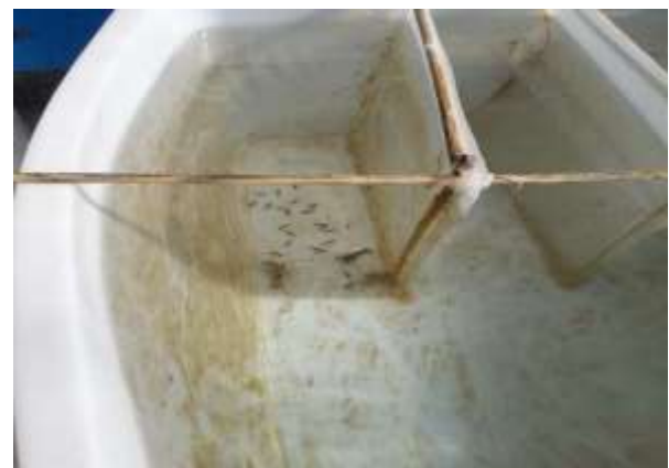
Gambar 1. Atraktabilitas Lobster pada pelet dengankonsentrasi kitosan 0.6% menit ke-15

Berdasarkan Tabel 2, terlihat adanya perbedaan rerata jumlah lobster yang hadir pada berbagai konsentrasi kitosan dari eksoskeleton lobster air laut terhadap daya tarik pakan buatan. Pada perlakuan tanpa kitosan (0%), tercatat sebanyak 54 ekor lobster hadir dalam waktu 15 menit.