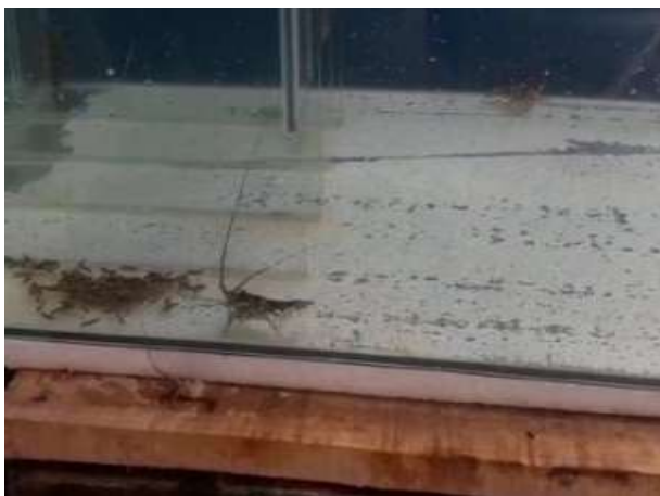
Gambar 2. Atraktivitas lobster pada pelet dengankonsentrasi kitosan 0.9% menit ke-15

Berdasarkan hasil pengamatan pada Gambar 1, diketahui bahwa pemberian pakan buatan dengan konsentrasi kitosan 0,6% dari eksoskeleton lobster air laut menunjukkan tingkat atraktivitas yang baik. Hal ini ditunjukkan oleh kehadiran 3 ekor lobster di ruang uji pada menit ke-15 dari total 5 ekor lobster yang ditempatkan dalam wadah uji.