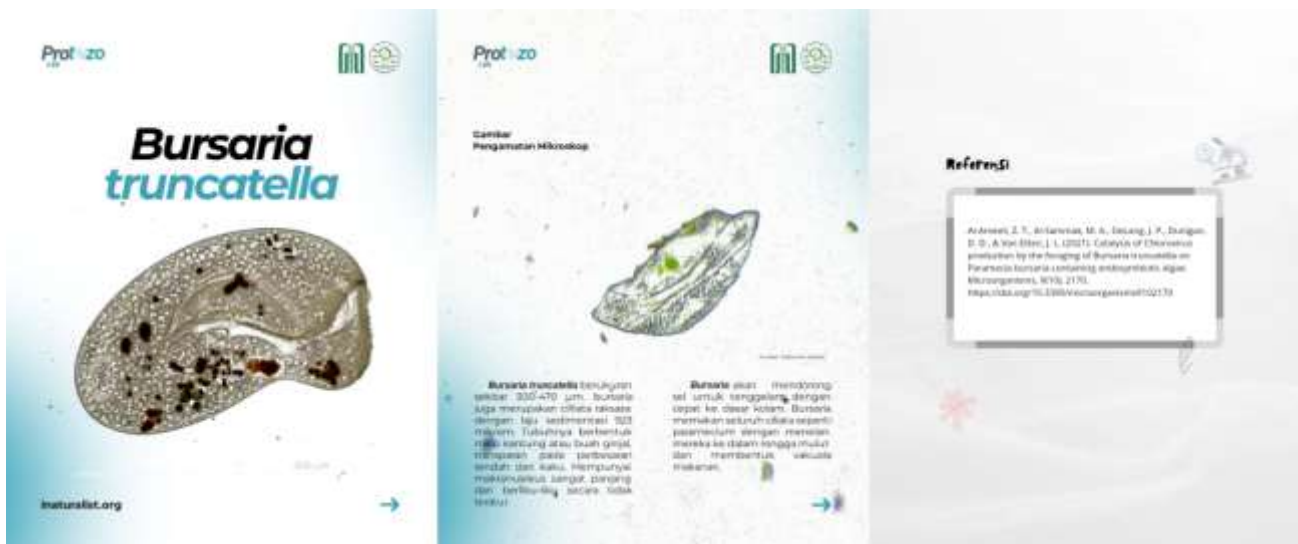
Gambar 7. Layout Feed Jenis Protozoa Slide 1-3

Dengan hal ini mahasiswa memiliki ketertarikan dalam belajar protozoa dengan media pembelajaran tambahan yang mudah diakses dimanapun dan kapanpun serta kepraktisan dalam memahami materi.