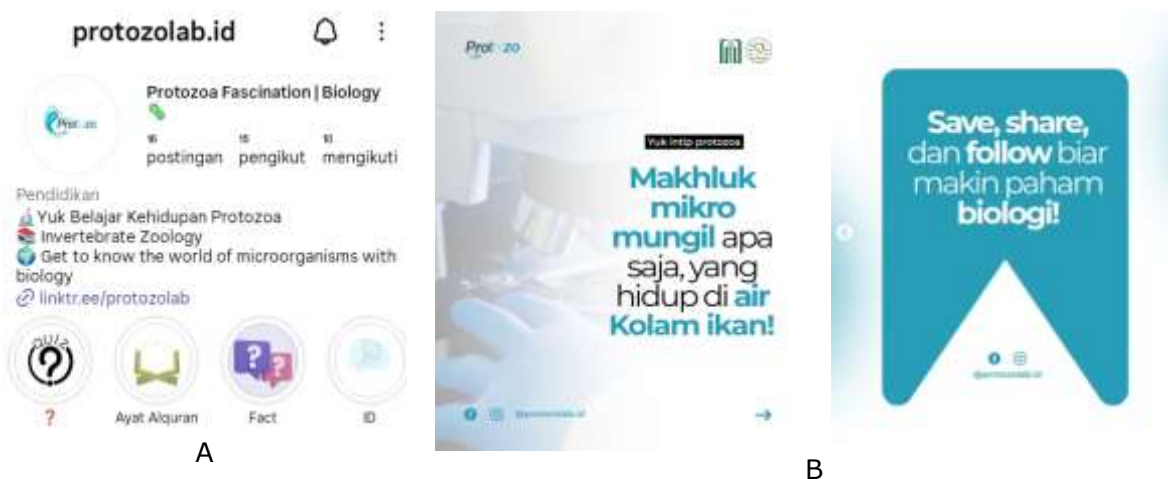
Gambar 6. (A) Desain Profil dan Bio. (B) Feed Teaser Post

dilakukan untuk mendapatkan saran dan kritik tentang pembuatan microblog Instagram yang memuat konten protozoa. Adapun rancangan microblog Instagram yang telah disusun berdasarkan dari hasil pengamatan protozoa pada air kolam ikan di Desa Ringinpitu sebagai berikut: