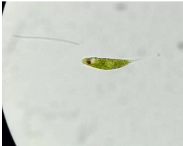
Gambar 5. Protozoa hasil pengamatan Euglena viridis