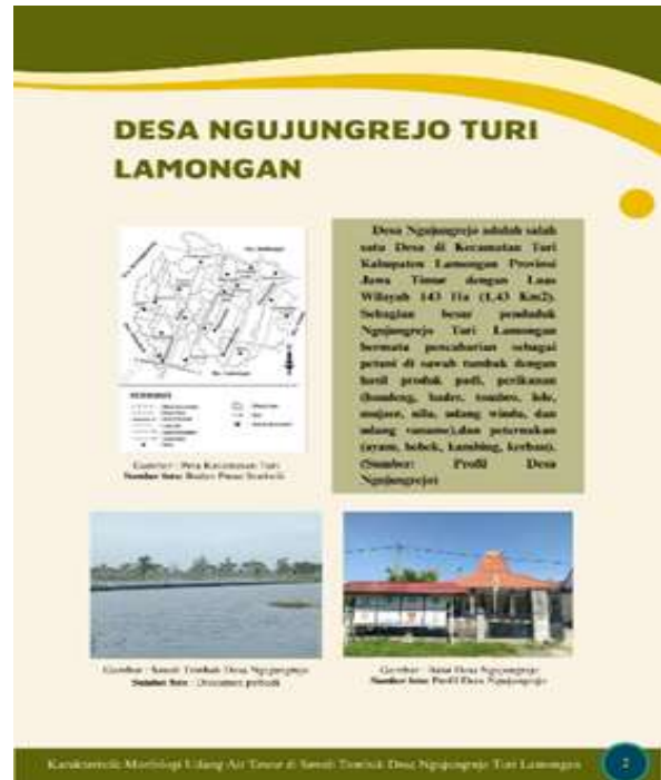
Gambar 2. Profil Desa Ngujungrejo