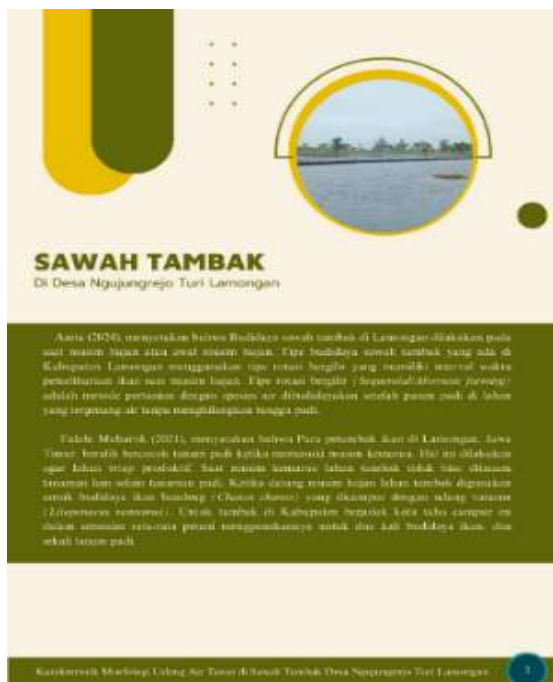
Gambar 3. Pengenalan Sawah Tambak