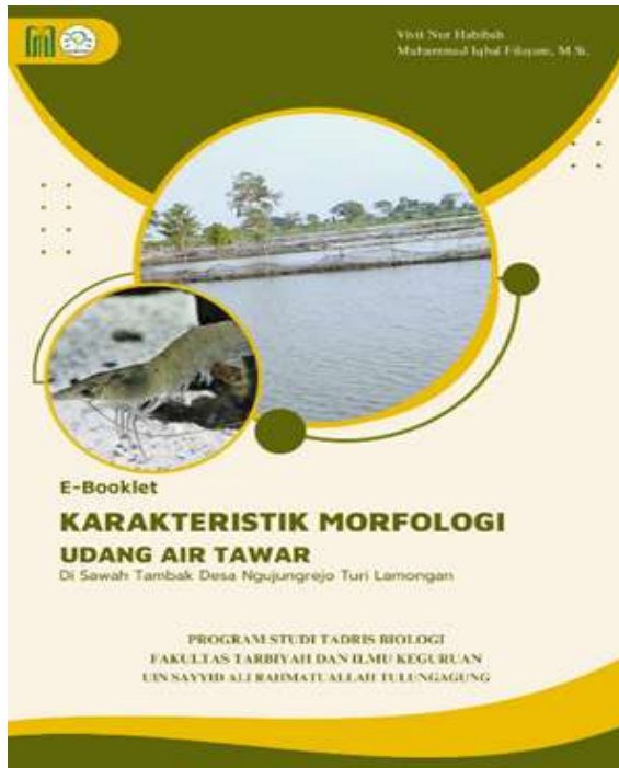
Gambar 1. Cover E-Booklet

dalam memperdalam pengetahuan mahasiswa, khususnya terkait materi dalam mata kuliah Zoologi Avertebrata. E-Booklet dapat diakses melalui link tersebut https://heyzine.com/flip-book/b0a21f81d5.html .